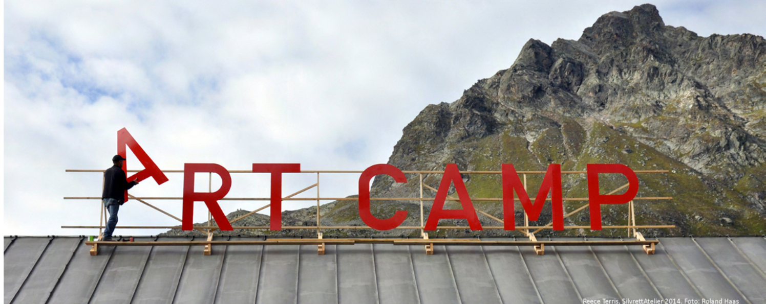
Reece Terris, SilvrettAtelier 2014. Foto: Roland Haas