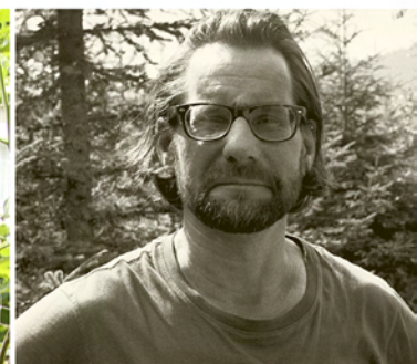
Christoph Grill (* 1965, A) Fotografie