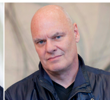
Karl-Heinz Ströhle (* 1957, A) Skulptur, Objekt, Konzeptkunst